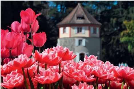
Frühling auf Insel Mainau

Geniessen Sie exquisite und regionale Produkte von Chocolaterie Wellauer & Co., Goba, Gottlieber und Macardo Swiss Distillery auf dem «Genuss-Schiff» – MS Sântis. Die Selection Schwander lädt Sie zu einer Wein-Degustation (gegen eine kleine Pauschale) ein. Zudem bietet die Brauerei Schützen-garten ihre Spezialbiere zum Degustieren an.