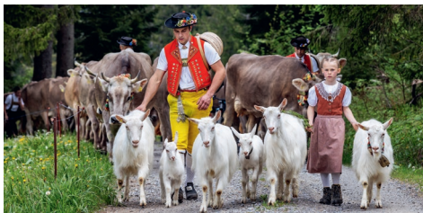
Frühling im Appenzellerland

Weitere Informationen: www.wuerth-haus-rorschach.ch