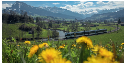
Unterwegs mit dem Turbo im Frühling

Anmeldeschluss für das Turnier ist der Sonntag, 2. April 2023